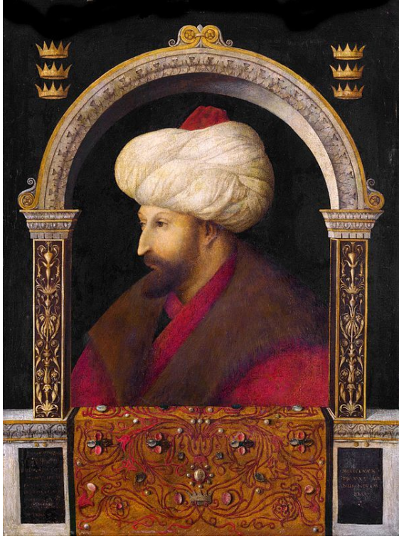
Oğlu ve İstanbul fatihi II. Mehmed