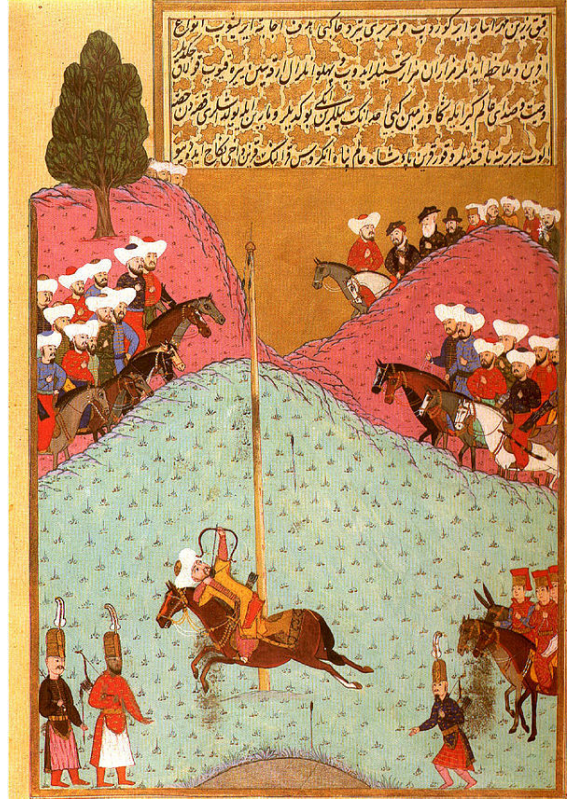
Sultan II. Murad

Murat'ın babası Mehmet'in ölümünden sonra saltanat davası güden şehzadeler dolayısıyla üç yıl süren büyük bir bunalım izlendi.