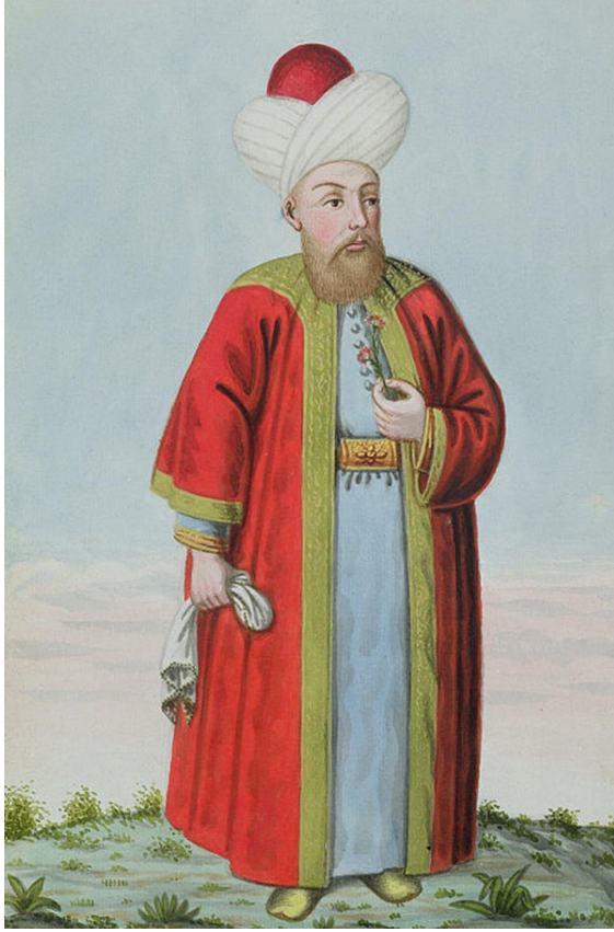
Sultan II. Murad'ın John Young tarafından yapılmış resmi

Osmanlı iç savaşı sırasında Balkanlarda Macar etkisi artmış ve 1427 yılında Sırp Despotu Stefan Lazareviç'in ölümü üzerine Macaristan ile Osmanlılar arasında Sırbistan tahtı üzerinde çekişme çıkmıştır.