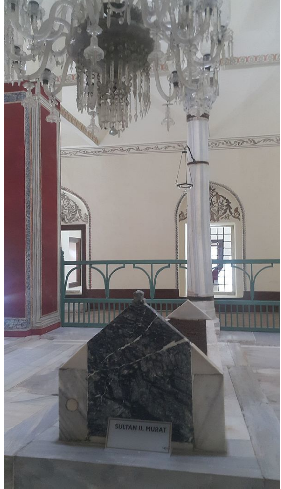
II. Murad türbesi

Sırbistan'da intikam alan Sırp tarafından öldürüldüler. Savaş meydanından kaçan János Hunyadi Sırp Despotu Yorgo Brankoviç askerleri tarafından yakalandı. Brankovic Janos Hunyadi'yi tutukladı. Serbest bırakmak için 100.000 altın florin fidye aldı; Macar Krallığı'nın işgal etmiş olduğu geleneksel Sırbistan toprakları tekrar Sırbistan idaresine verildi ve Hunyadi'nin varisi olan oğlunun Brankoviç'in kızı ile evlenmesi için nişan yapılmasını Hunyadi kabul etti. Ancak bu şartlar gerçekleşince Sırp Despotu Brankoviç János Hunyadi'nin Macaristan'a dönmesine izin verdi.