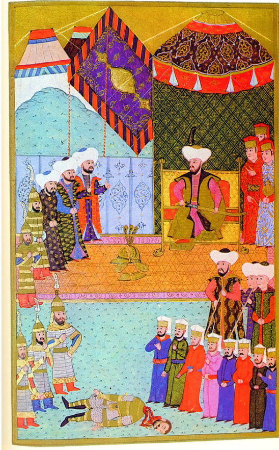
II. Murad ve John Hunyadi

Aynı yıl Evrenosoğlu İshak Bey idaresindeki akıncılar Arnavutluk'a ve yerel Arnavut beylerine karşı bir sıra hücumu geçti. Gjion Kastrioti ve Atariti adlı Arnavut beyleri ancak II. Murad'ın üst egemenliğini kabul edip bu akınların önüne geçebildiler. Kastrioti 4 oğlunu Edirne'deki Osmanlı sarayına rehin ve eğitim almak için göndermek zorunda kaldı. Bu çocuklardan en küçüğü olan İskender Bey sonradan Osmanlı devleti başına büyük başarılar çıkartmıştır. [1]